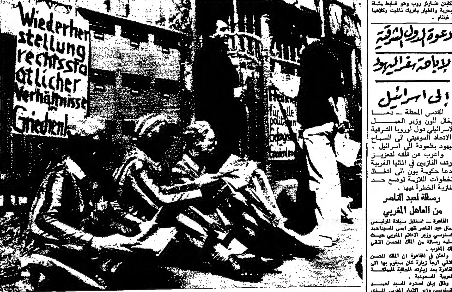
تلا من اثينا اليونان اقتصدوا الأرض أمام مبنى القنصلية اليونانية، وهم يرتدون ملابس السجناء، للاحتجاج على اعتقال المثمن وسجنهم في اليونان ويرى زميل لهم يتحدث مع أحد موقفي القنصلية... في الموضوع (صورة للبريتانيديس) .